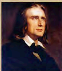
Franz Liszt, 1811-1886

而李斯特(Franz Liszt, 1811-1886)就把這種突破形式的這種精神發揮的更加的淋漓盡致，剛才提到莫札特寫的《唐·喬望尼》，李斯特用這首這齣歌劇改編成一首《唐璜回憶錄》的鋼琴獨奏曲，把這齣歌劇裡面很多著名的片段湊在一起，但我們發現在莫札特的歌劇裡面最後得勝的是正義的審判。在浪漫主義者的眼中真正的英雄是唐·喬望尼，唐·喬望尼有為所欲為的魄力這才是真英雄，他不被世俗的道德倫理所捆綁，他堅持做他想做的那個自己，他寧可下地獄都要堅持做唐·喬望尼，這個就是浪漫主義者所高舉的英雄，結果我們會發現在李斯特的《唐璜回憶錄》裡面，最後得勝的音樂不是那個審判D小調的音樂，而是我們剛才聽到的那首《唐·喬望尼》誇勝的香檳飲酒歌。對不起，我很不喜歡這位鋼琴家，但是他來演奏這首還滿適合的，不是說他演奏的好，是演奏的很適合。我們跳到後面，這是那個飲酒歌的一個片段，這是審判的音樂，審判的音樂跟飲酒歌交織在一起在打架，最後誰得勝呢？聽起來好像審判要得勝了，道德要得勝了，結果最後是誰勝出了？是《唐·喬望尼》的飲酒歌。