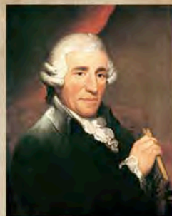
Franz Joseph Haydn, 1732-1809

莫札特、貝多芬這個時期，海頓(Franz Joseph Haydn, 1732-1809)這個時期被稱為古典時期，像莫札特這樣子的作曲家非常重視作曲的形式，他也非常重視理性與道德對人生活的規範。但是到了十九世紀人們就開始厭惡這種形式的規範、道德的規範、理性的規範，就產生了所謂的浪漫主義。浪漫主義就是對那種理性、道德形式的一種反動，它想要突破形式，各種的形式的規範，不管是音樂或者是倫理，或者是文學的一些規範。